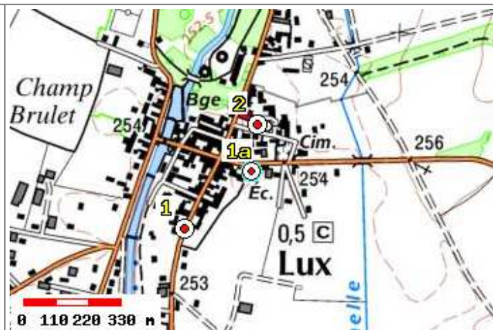
Carte : 3122 MIREBEAU